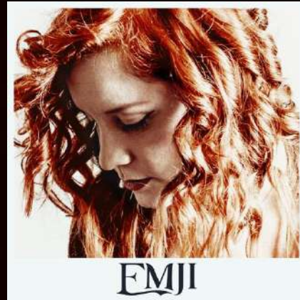
EP - 2015