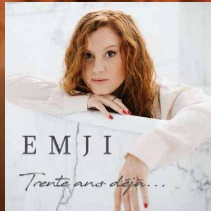
SINGLE - 2019