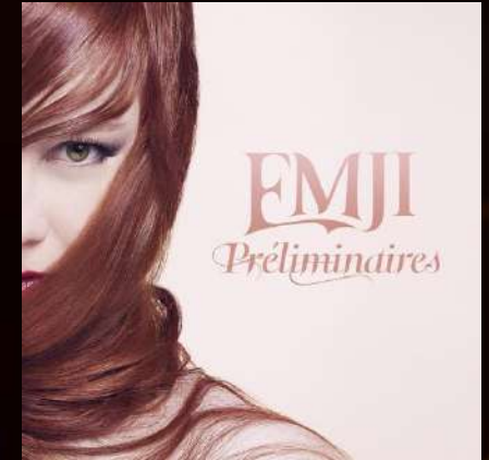
EP - 2016