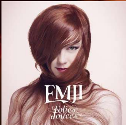
ALBUM - 2016