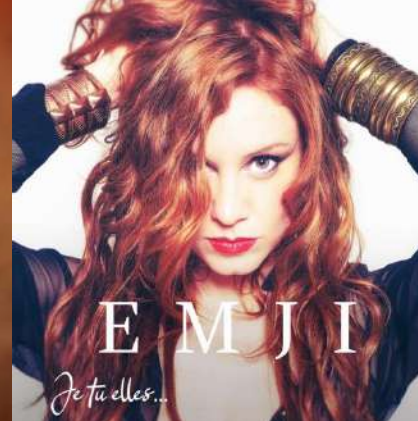
ALBUM - 2019