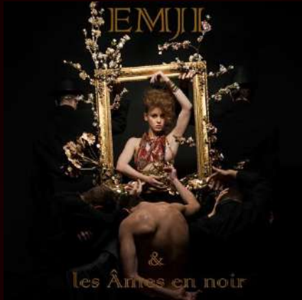
EP - 2013