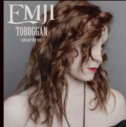
SINGLE - 2015