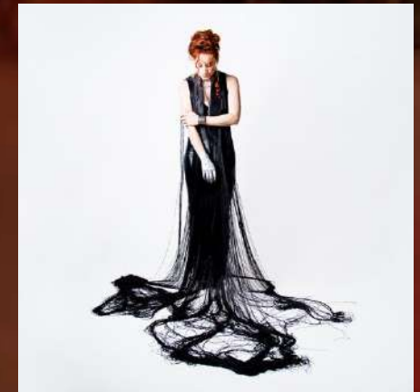
ALBUM - 2025