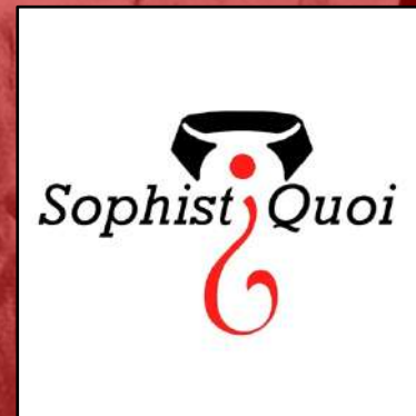
La compagnie Sophistiquoi

Depuis 2007 il travaille avec «Cirque du Soleil» comme clown dans le spectacle «Alegria» et «La Nouba». En parallèle il continue ses spectacles et créations ainsi que son travail de pédagogue avec «Cirque du Soleil», «Cirque du Monde» et l'«ESAD à Murcia».